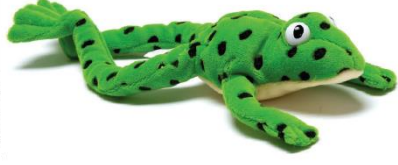
Fred the frog ফ্রেড ব্যাঙ